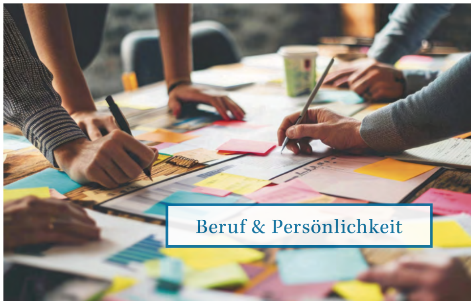
Beruf & Persönlichkeit

In Kooperation mit der NRW-Fachberatung „gerne anders!“ Sexuelle Vielfalt und Jugendarbeit. together mülheim, Ecke Eppinghofer Str./Dickswall, 45468 Mülheim an der Ruhr